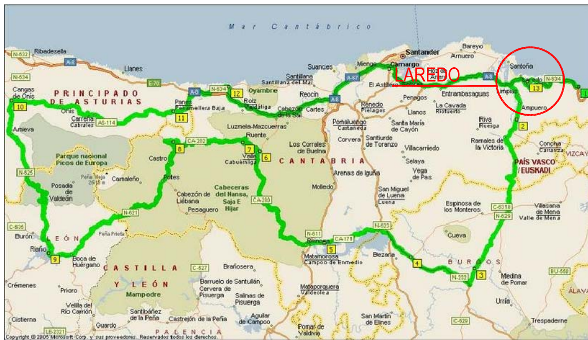
LOCALIZACIÓN GEOGRÁFICA: LAREDO